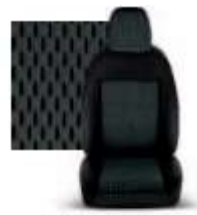
STAR GRIGIO 213