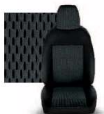
STAR GRIGIO 213