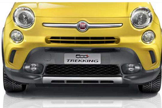
Спеціальний передній бампер