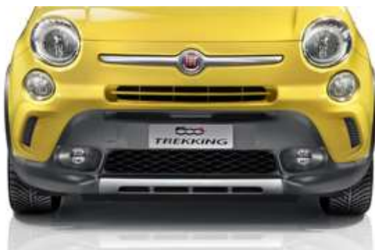
Спеціальний передній бампер